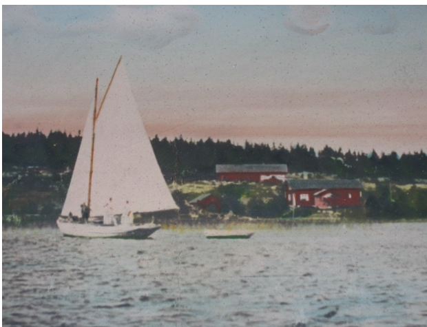
Barndomshemmet på Horsholm

Jag är uppvuxen på Näsbyholmarna. Houtskärsborna vet väl inte var vi finns, men när man åker in till Åbo från Näsby, så går farleden på norra sidan om Horsholm. Vi var fem familjer på holmarna när jag var barn och jag var enda barnet. Det var två familjer på Långholm, en familj på Ängholm, en familj på Hjälholm och så var vi två familjer på Horsholm. Vi bodde på södra sidan. Grannen var inflyttad från Rimito.