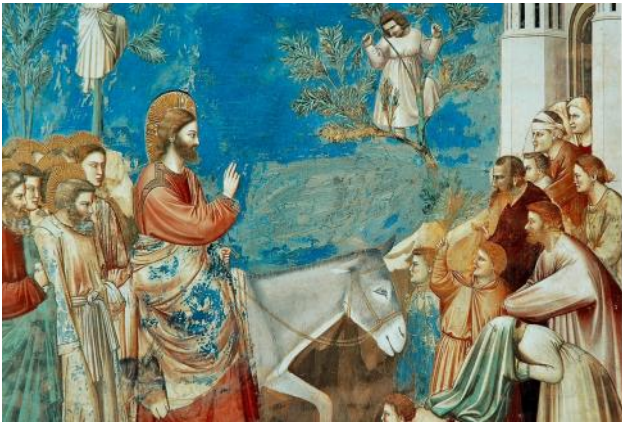
Giotto di Bondone, Entry into Jerusalem (Scrovegni Chapel, Padua, c. 1305)

Vogler arbetade som kapellmästare vid Kungliga Teatern i Stockholm i tretton år, och under den tiden blev Hosianna till. Hans sätt att leda musik var mycket engagerande, och någon har också påstått, att hans orgelkonserter hade något av cirkus över sig. Den 20 mars 1796 gav Vogler en konsert i S:ta Clara kyrka i Stockholm, med ett verk som skildrade Kristi lidandets historia, där körsången Hosianna ingår i andra satsen av tio.